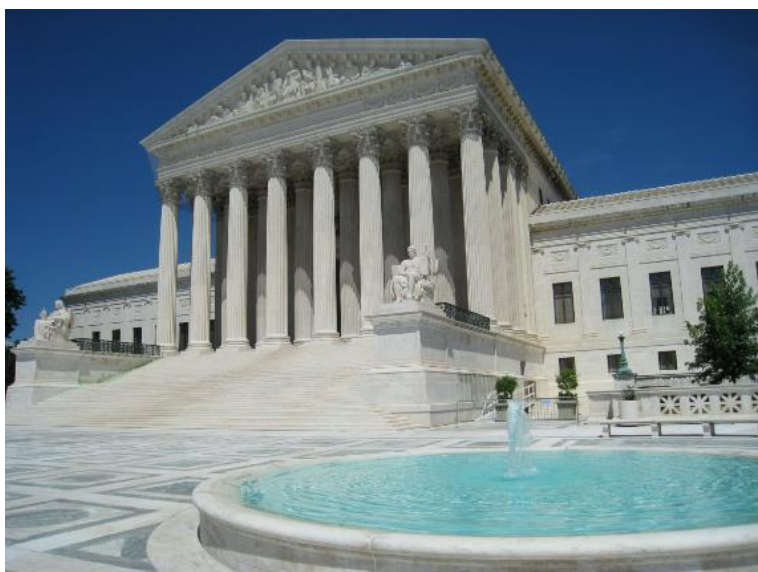
Edificio de la Corte Suprema, Washington, DC, EE.UU.

Estos cambios de percepción pública ocurren regularmente como resultado de cambios demográficos y divisiones ideológicas. Pero sobre todo, reflejan una preocupación subyacente por garantizar que tanto la Constitución como ley garanticen el resultado más justo.